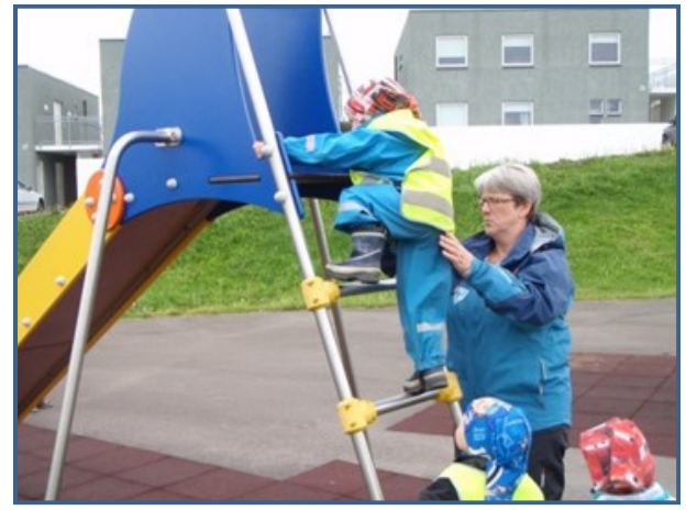
Við sýnum börnunum umhyggju.