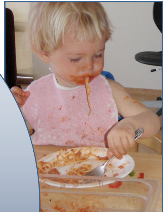
Börnin fá holla næringu.

Svona vinnum við með heilbrigði og velferð í skólanum okkar.