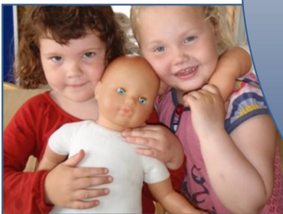
Við eflum jákvæð samskipti á milli allra í skólanum.

Í leikskóla eiga börn að læra um og tileinka sér heilbrigða lífshætti, hollt mataræði, hvíld, hreinlæti og hreyfingu. Hreyfing getur haft í för með sér gleði og ánægju og í gegnum hana læra börn. Hreyfing og vellíðan hafa jákvæð áhrif á samskipti barna, umgengni þeirra við umhverfi sitt og hæfni þeirra til að takast á við daglegt líf og nýjar aðstæður. Umhyggja á að skipa stóran sess í starfi leikskóla og mikilvægt er að starfsfólk leikskóla myndi góð og nán tengsl við börnin.*