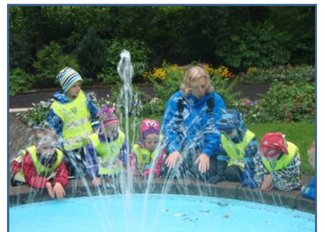
Við leggjum áherslu á tilfinningalegt jafnvægi barnanna.