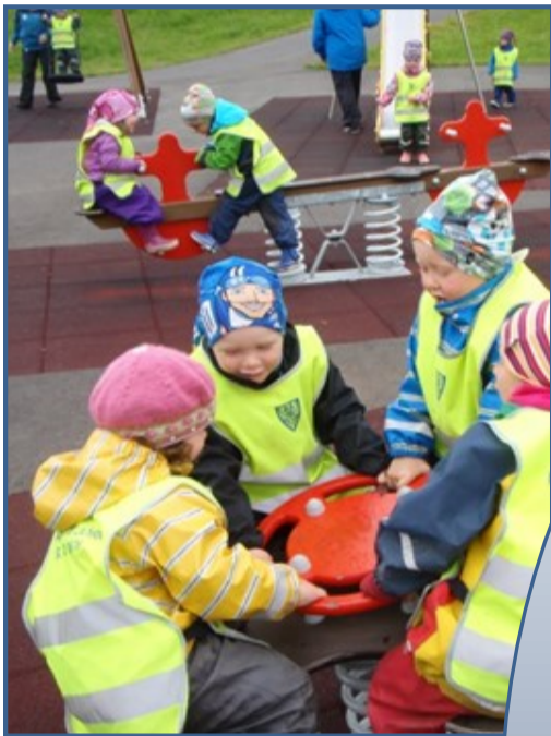
Börnin fá fjölbreytta hreyfingu.