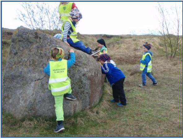
Börnin taka þátt í ögrandi og krefjandi útivist.