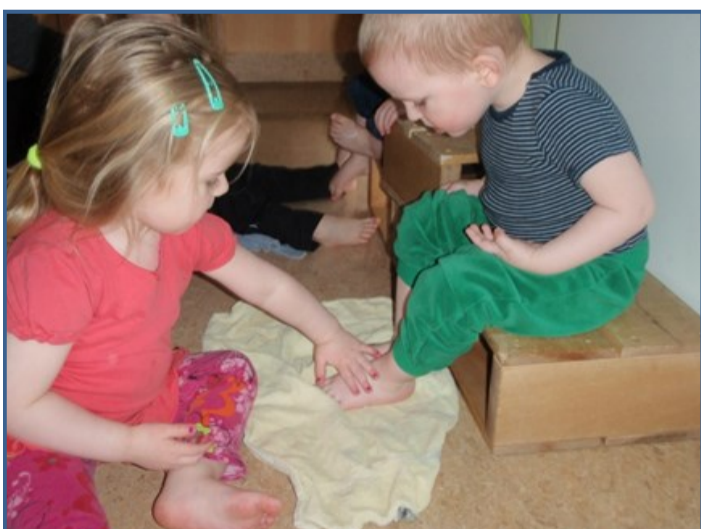
Við eflum félagsleg samskipti á milli allra í skólanum.